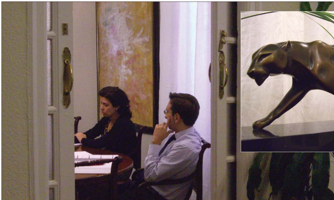
En el 2007, la firma inicia una nueva etapa en la que se culmina la instalación de la nueva sede principal en la zona de la calle Alcalá.